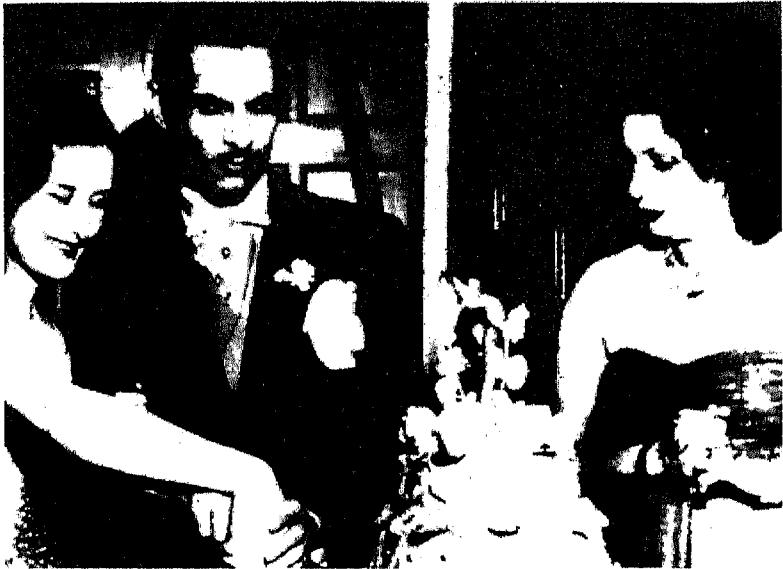
الملكة نازلى ورياض غالى والأميرة فتحية في حفل خطوبة إبتها من رياض